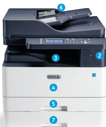
Urządzenie wielofunkcyjne Xerox® B1025

Pokazana konfiguracja podajnika DADF z opcjonalną tacą dodatkową.