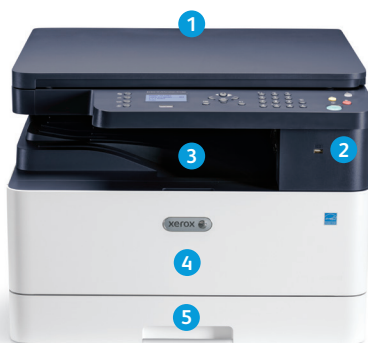
Urządzenie wielofunkcyjne Xerox® B1022

9 Urządzenie Xerox® B1025 jest wyposażone w większy, 4,3-calowy kolorowy interfejs ekranu dotykowego , dzięki któremu obsługa jest jeszcze prostsza.