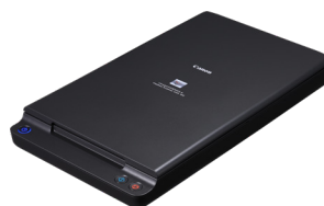
Skaner płaski A4 - moduł 102