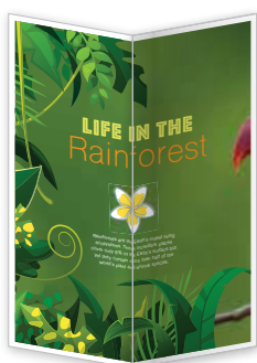
Składanie na pół