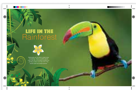
Drukowanie dużych formatów 11 x 17/A3 ze spadem

Dzięki drukarce kolorowej Xerox® VersaLink® można tworzyć gotowe produkty na szerokim asortymencie nośników, zgodnie z intencjami grafików.