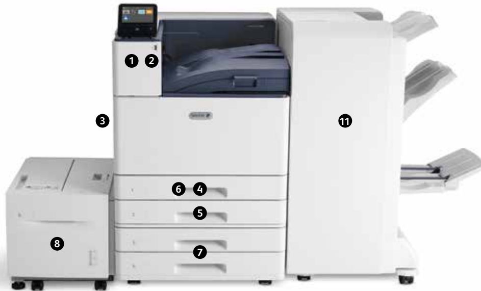
Drukarka kolorowa Xerox® VersaLink® C9000 Druk. Łączność mobilna.