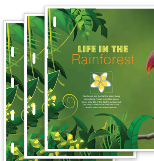
Zszywanie w wielu miejscach