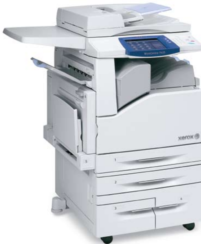
WorkCentre 7435 z powierzchnią roboczą, podwójnym zasobnikiem o dużej pojemności oraz zintegrowanym biurowym urządzeniem wykańczającym