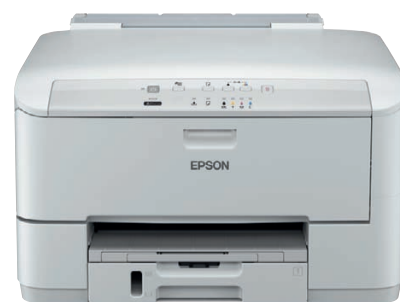
Model WP-4095 DN